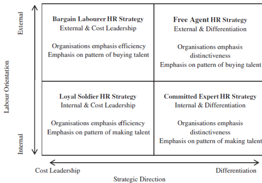
Gambar 1. Empat Strategi Manajemen SDM

suatu organisasi memiliki orientasi kerja internal atau eksternal (Stewart & Brown 2011). Organisasi yang memiliki orientasi kerja internal mencari hubungan jangka panjang dengan karyawan, sedangkan organisasi yang menunjukkan orientasi kerja eksternal tertarik pada fleksibilitas dan tidak memiliki komitmen jangka panjang dengan karyawan. Dua set dimensi — “ cost leadership ” vs. diferensiasi, dan orientasi kerja internal vs eksternal orientasi kerja digabungkan untuk mengembangkan empat strategi SDM yang berbeda, yang meliputi “ Loyal Soldier ” (“ cost leadership ”/ tenaga kerja internal), “ Bargain Labourer ” (“ cost leadership ”/ tenaga kerja eksternal), “ Free Agent ” (diferensiasi / tenaga kerja eksternal) dan “ Committed Expert ” (diferensiasi / tenaga kerja internal).Empat strategi SDM tersebut disajikan pada Gambar 1.