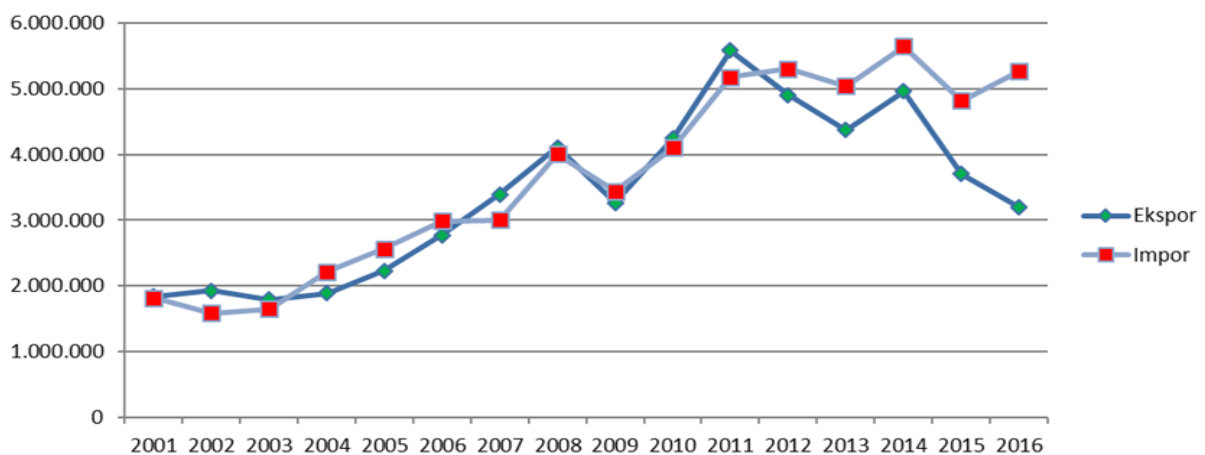
Gambar 1. Perbandingan Ekspor dan Impor Indonesia ke dan dari Australia

adalah Australia. Secara agregat pada tingkat regional, peran Australia sebagai tujuan ekspor meningkat sedangkan peran negara-negara di Eropa, Afrika dan Amerika menurun (Lembaga Penyelidikan Ekonomi dan Masyarakat – Fakultas Ekonomi dan Bisnis Universitas Indonesia, 2018b).